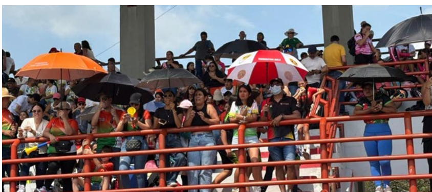
Padres de familia y demás asistentes animaron durante el evento a sus deportistas.

“llevamos más de 15 años en el Colegio Departamental de Juzgamiento, actualizándonos cada año, este año fuimos seis jueces a actualizarnos en la ciudad de Cali, cada año nos tenemos que certificar en el ranking nacional, en el interno tenemos 18 jueces de Garzón, Gigante, Rivera, La Plata y Neiva. El balance es totalmente positivo es el primer evento que organiza la Liga con nosotros como jueces principales, estamos haciendo las cosas lo mejor posible para que los resultados y los tiempos sean los mejores. El apoyo de UTRAHUILCA es fundamental tanto en los jueces que la Fundación lo han apoyado en su proceso de formación, y ya en el desarrollo del evento son fundamentales, UTRAHUILCA ha sido muy importante para el beneficio del patinaje del Huila.