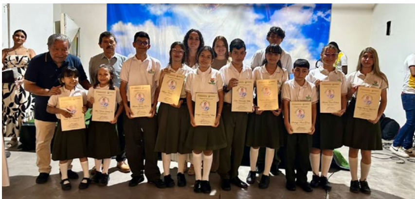
Cada uno de ellos representan los valores y principios cooperativos que la profe Yaneth inculcó en sus alumnos.