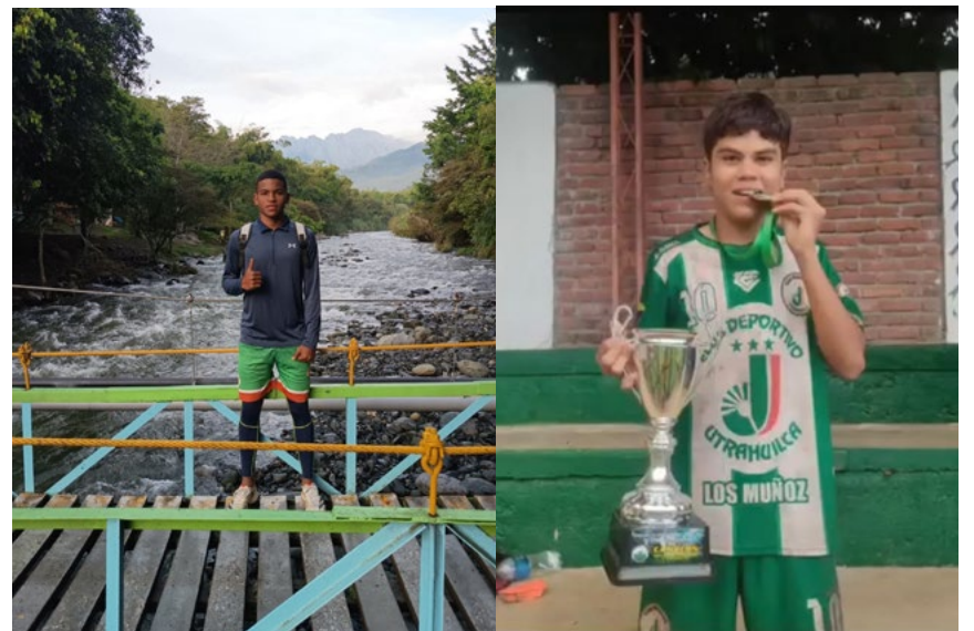
Ambos supieron vestir con orgullo la camiseta del Club Deportivo UTRAHUILCA

Este enfoque integral ha permitido que hoy dos de los suyos