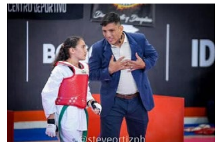
Los deportistas utrahuilqueños se destacaron en cada uno de los combates.

Departamental del año con pecheras electrónicas, así mismo desde ahora se proyectan su participación para el segundo semestre en el evento Copa Colombia también a realizarse en la ciudad de Bogotá.