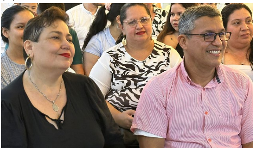
Una celebración a la vida, los valores y la comunidad, así fue recibido por los asistentes al evento.