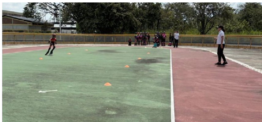
Pruebas de habilidad, velocidad y fondo se tuvieron en el festival.