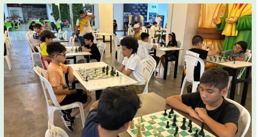
Categorías: Sub-8, Sub-10, Sub-12 y Sub-15 iniciaron competencias en el Grand Prix de Ajedrez.

activos en el desarrollo de tan importante torneo y vivir las emociones del deporte ciencia.