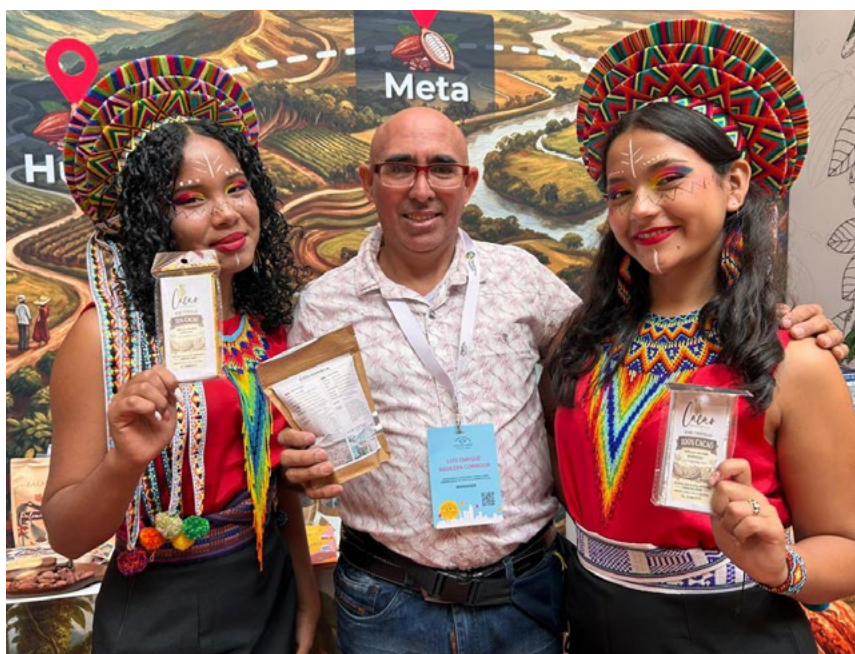
Los integrantes de la agrupación cautivaron a los asistentes durante la feria

El periplo internacional dejó una huella imborrable en la historia de la escuela. El nombre de FUNDAUTRAHUILCA y el del Putumayo brillaron en la capital de los Países Bajos, demostrando que el talento regional está listo para competir y deslumbrar en los escenarios más influyentes del globo. La delegación regresó con la satisfacción del deber cumplido, habiendo establecido puentes entre el agro colombiano y el mercado europeo a través del lenguaje universal de la danza.