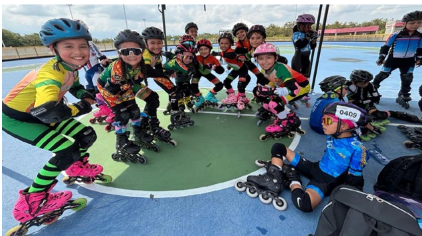
Deportistas de UTRAHUILCA mostraron el trabajo de formación desde cada uno de sus municipios.