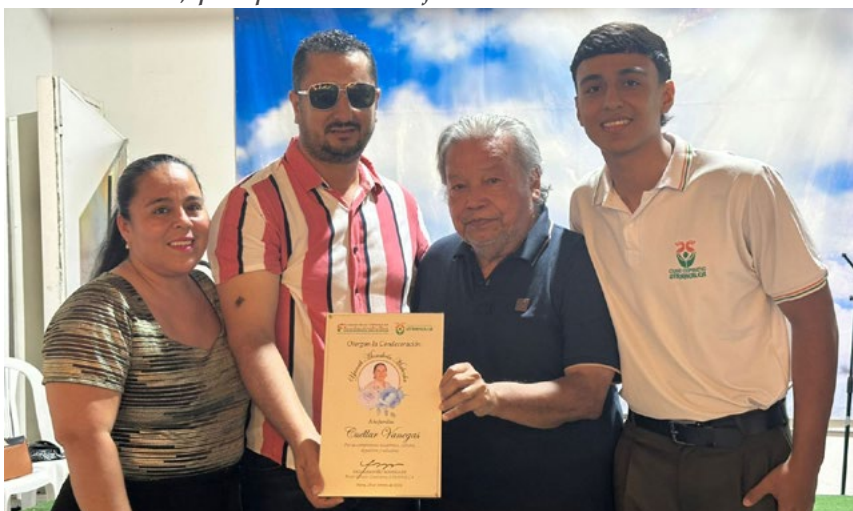
Familia Cuéllar Vanegas, una de las acreedoras del reconocimiento.