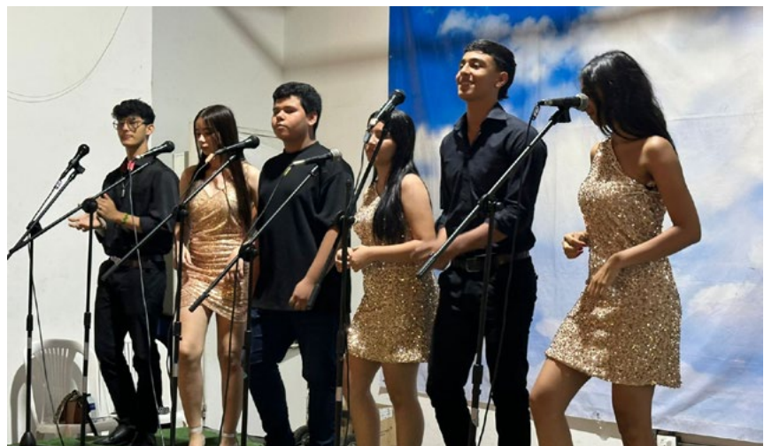
La muestra artística estuvo a cargo del grupo Fiesta Solidaria de FUNDAUTRAHUILCA.