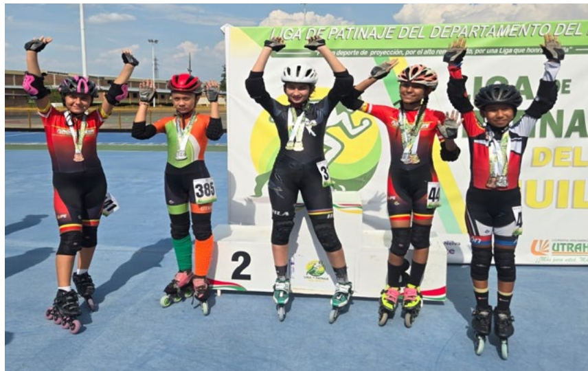
Los clubes de UTRAHUILCA brillaron en el pódium.

De esta manera inició con pie derecho el calendario deportivo desde la disciplina de patinaje en el Huila, demostrando el proceso formativo de los clubes pertenecientes a UTRAHUILCA, todo encaminado a la conformación de una selección sólida para futuras competencias a nivel de la regional y nacional, al final los deportistas recibieron medallas de participación, además de la entrega de medallas por lograr los primeros tres mejores resultados en cada una de las pruebas y categorías.