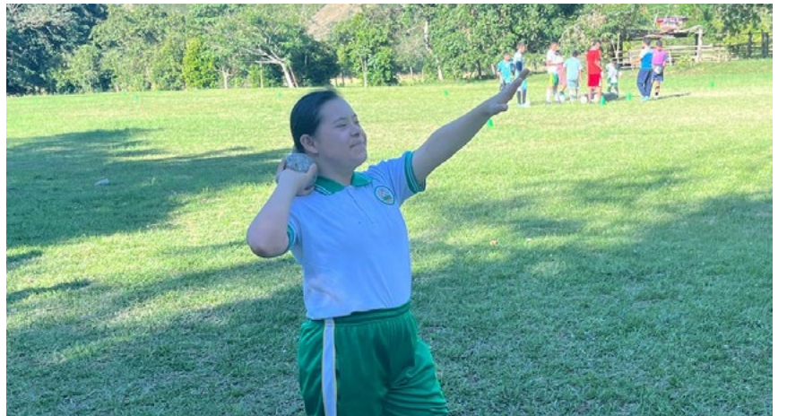
Una labor de inclusión en el deporte que brinda FUNDAUTRAHUILCA.