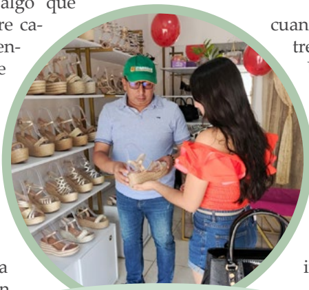
Una excelente atención se les brinda a las clientes

cuando decidió estrechar lazos con UTRAHUILCA.