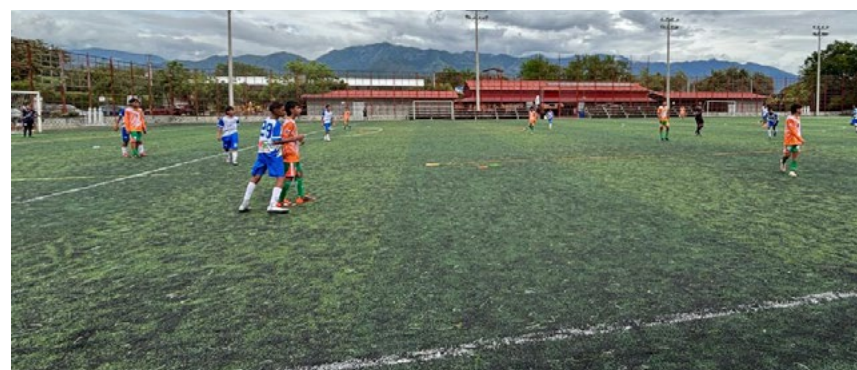
Nivel de competencia alto en cada compromiso