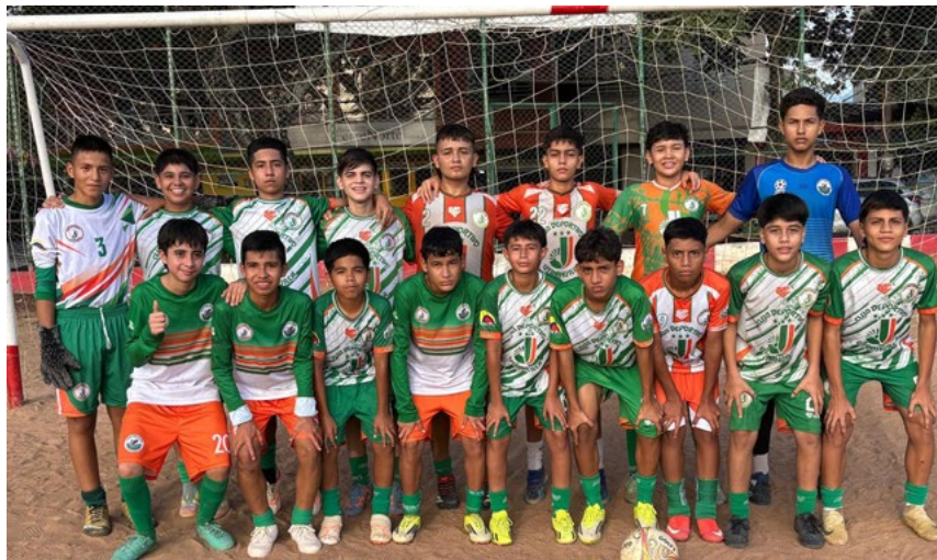
Avanza el Torneo Nacional Sub. 15