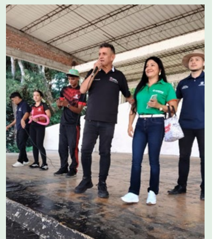
Durante el desarrollo de la actividad.