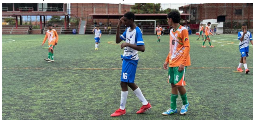
El pasado 17 de mayo el equipo utrahuilqueño logró una destacada victoria.