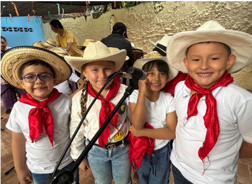
Estudiantes del grado Segundo en su presentación.

El Colegio UTRAHUILCA realizó por tercer año consecutivo el Concurso del Coro Asociativo, una importante actividad que promueve el desarrollo de las habilidades desde el campo artístico. Los ganadores disfrutarán en octubre de una tarde de cine como premio a su esfuerzo y dedicación.