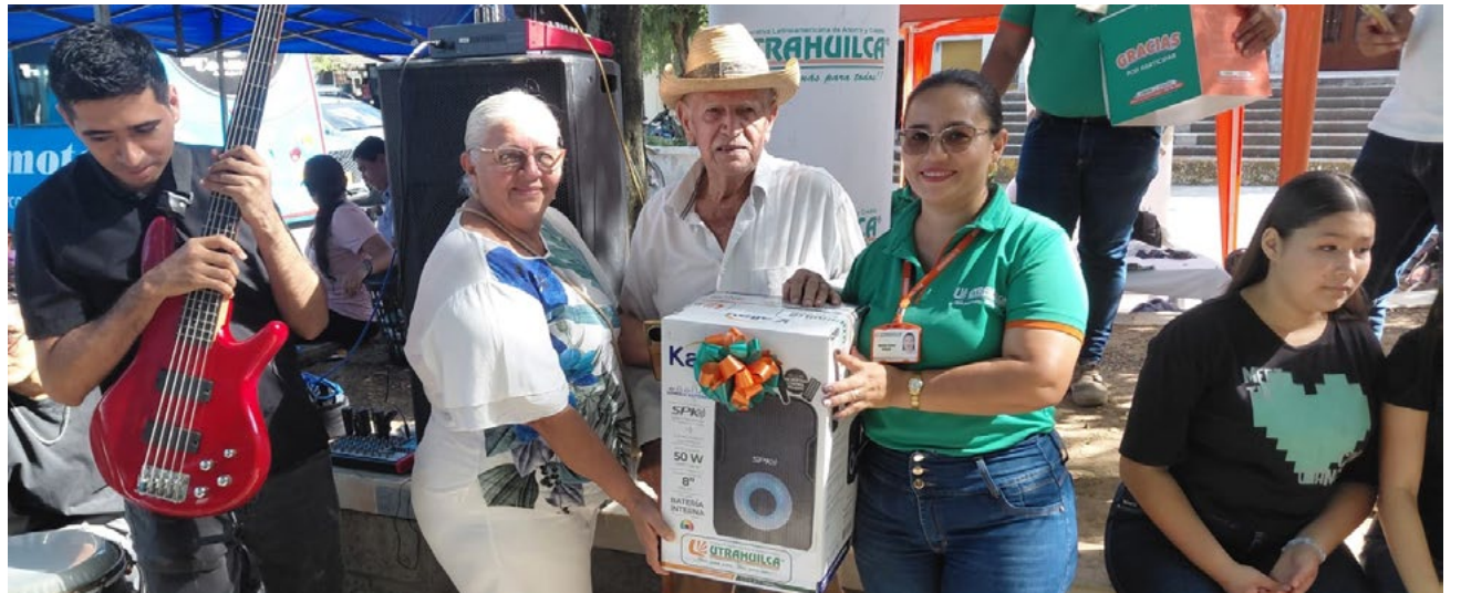
Fabulosos premios entregó UTRAHUILCA en Palermo.

Durante las jornadas se tuvo además la oportunidad de mostrar la parte cultural a cargo de los procesos que lidera en el