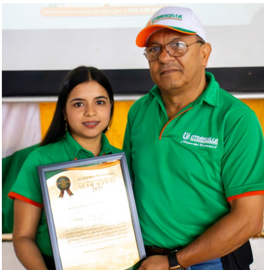
A cada funcionario y funcionaria se le entregó una placa