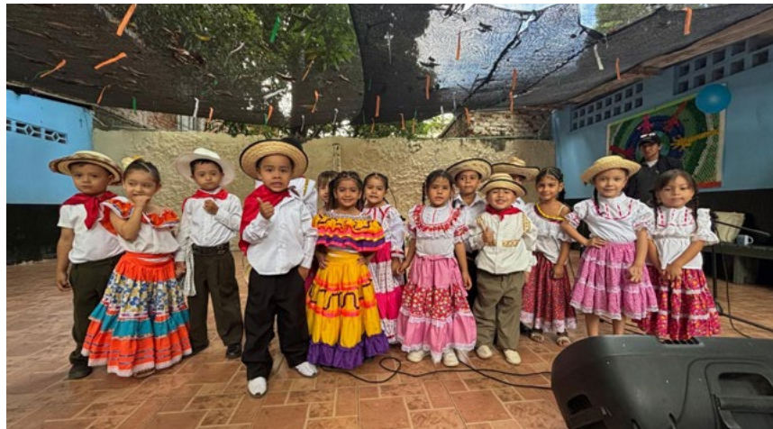
Con su dulce voz, los niños del grado Jardín cautivaron a los asistentes.