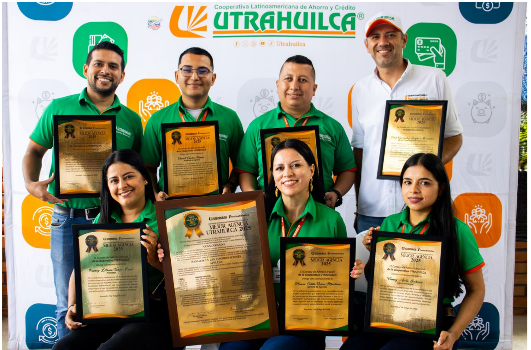
Equipo de talento humano de la agencia UTRAHUILCA Acevedo

La agencia de UTRAHUILCA en Acevedo alcanzó la máxima distinción institucional al fusionar la solidez financiera con un impacto comunitario brillante. A través de la presencia directa en el campo y el fomento del talento infantil se demuestra que el cooperativismo rinde sus mejores frutos cuando el servicio abandona la comodidad de las sillas para caminar hombro a hombro con asociados y asociadas.