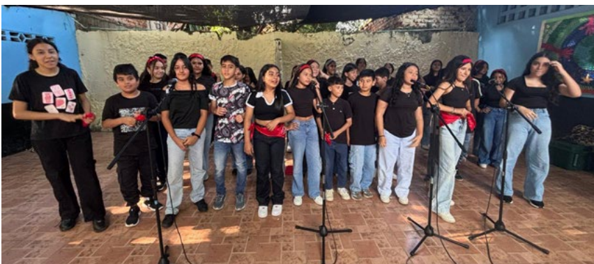
Los grados Sextos y Séptimos mostraron su talento en el escenario.