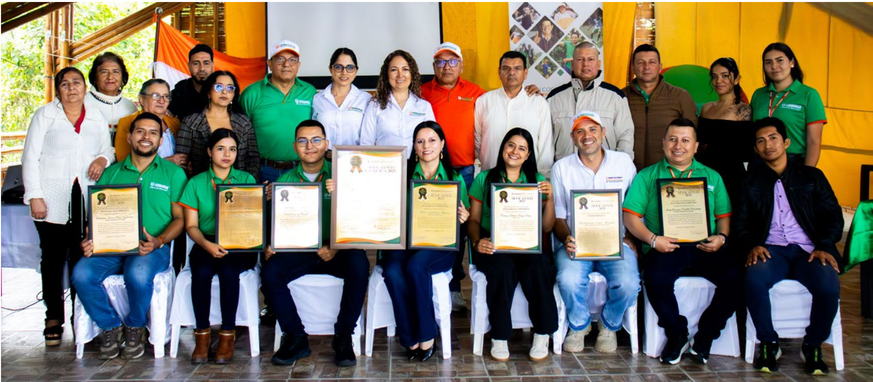
Familiares, amigos e integrantes del Grupo GACU acompañaron la jornada