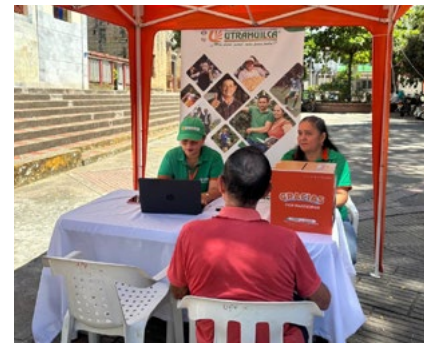
Durante tres días se realizó el encuentro comunitario que llegó de igual manera al municipio de Teruel.

los premios, la comunidad en general agradeció a UTRAHUILCA por la generación de estos espacios.