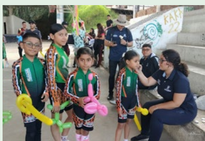
Pintucaritas y otras actividades se desarrollaron durante la jornada.