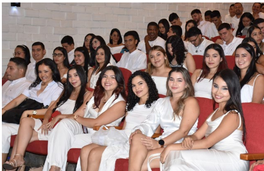
Importantes jornadas de acercamiento y sensibilización se desarrollaron en la universidad