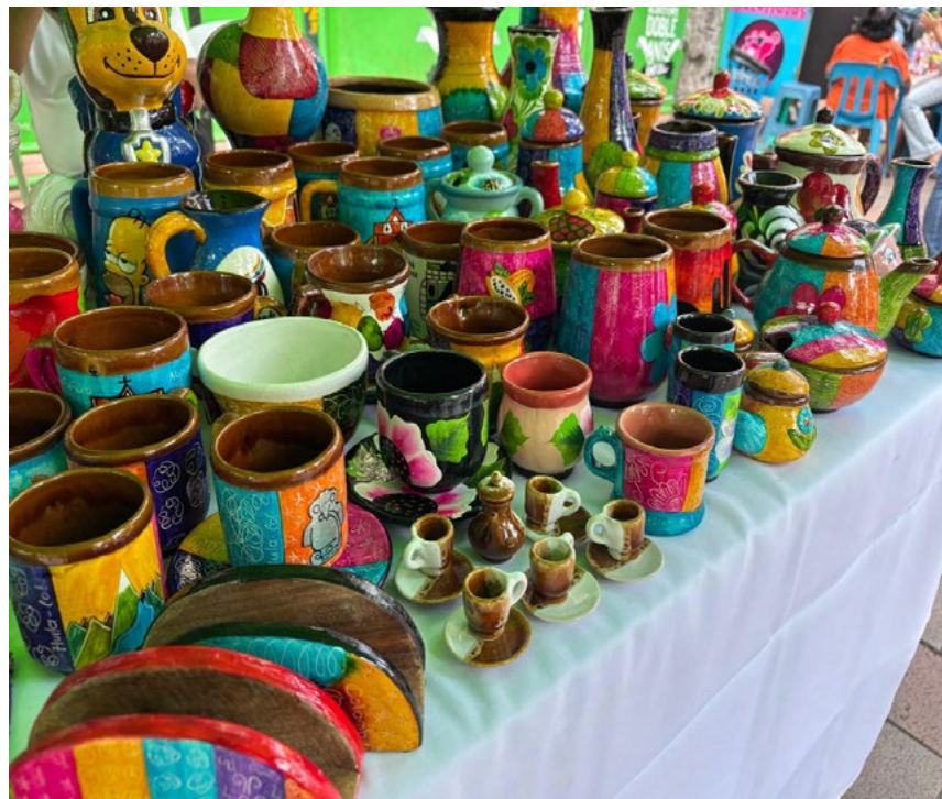
Incentivar la economía local, mediante el fortalecimiento de los emprendimientos regionales fue el propósito de esta actividad.