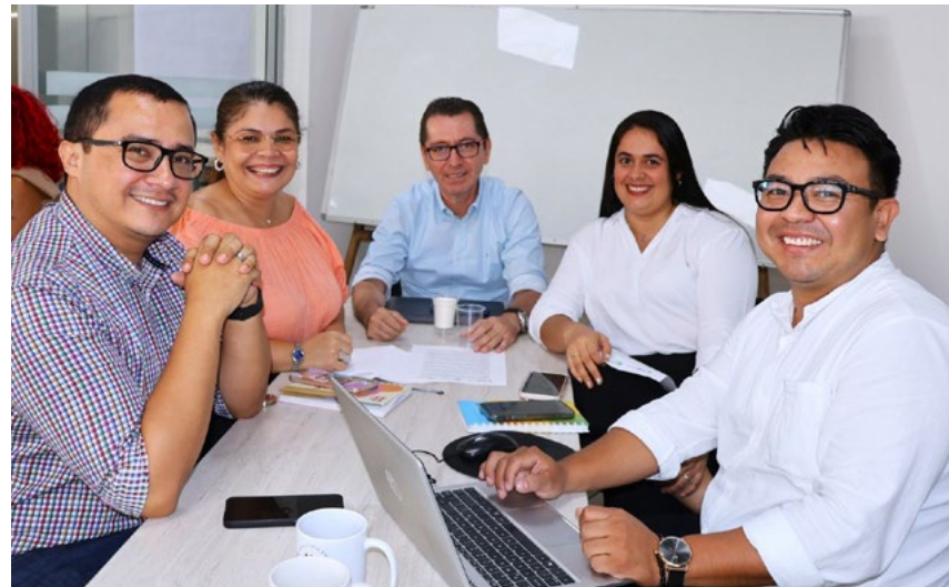
Desde todas las áreas se ha apoyado la iniciativa

de los diez campus del país ante el Consejo Nacional de Acreditación (CNA), con el fin de evidenciar que los procesos académicos, adminis-