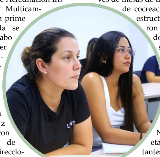
Los estudiantes son claves en este proceso

La Acreditación Institucional Multicampus es un proceso de carácter institucional que involucra a estudiantes, profesores, administrativos, egresados y el sector real en aras de respaldar y ratificar la calidad que se brinda en la institución.