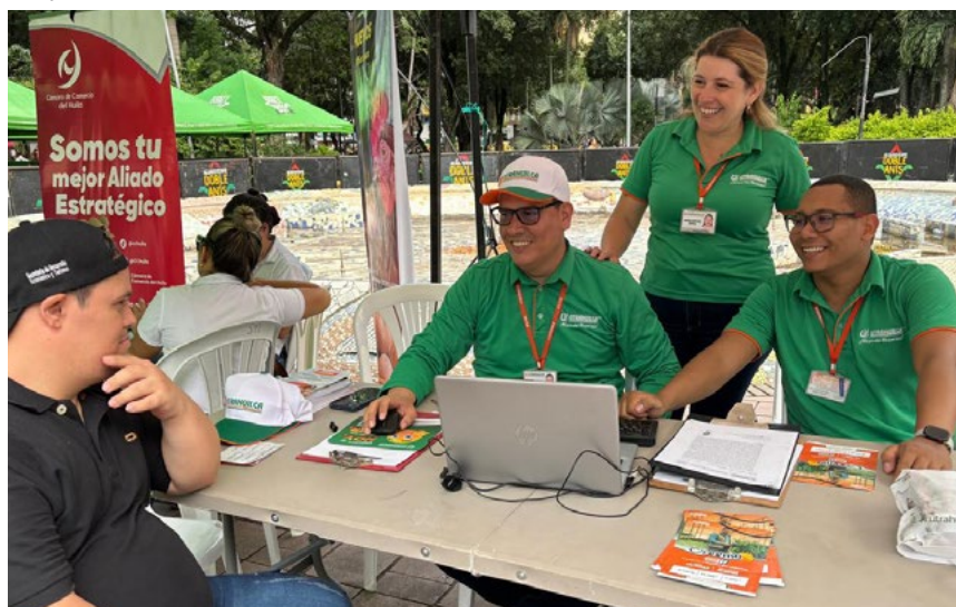
UTRAHUILCA se hizo presente en la feria con el apoyo a los emprendedores en créditos y asesoría para el fortalecimiento de sus unidades productivas.

música de UTRAHUILCA de Palermo y la agrupación Fiesta Solidaria de Neiva, animaron a los asistentes.