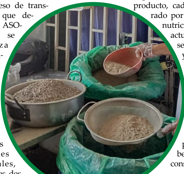
Ya el banano convertido en harina, dando facilidad y versatilidad de uso.