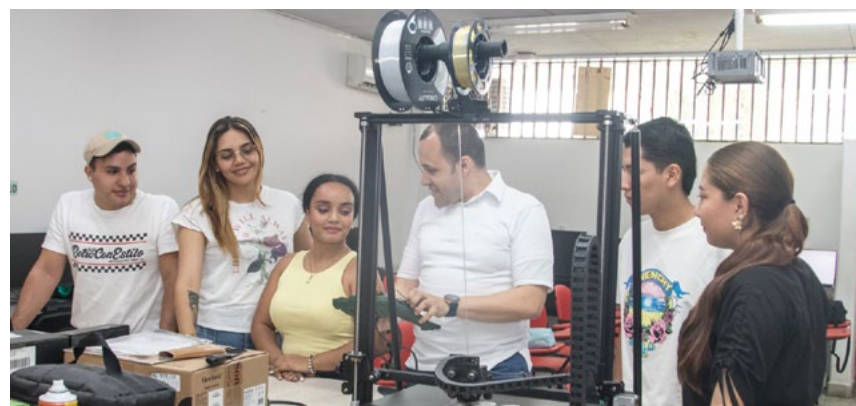
La Universidad Surcolombiana cuenta con siete grupos de investigación, uno de ellos reconocido ante Minciencias, Cesurcafé, y otros dos que radicaron la documentación pertinente para alcanzar el mismo reconocimiento.