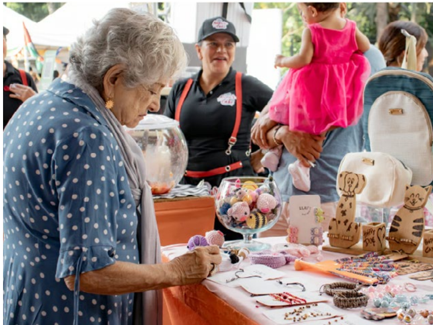
FundaConfiar prepara lo que será la realización del Bazar de la Confianza 2026.

La cooperativa Confiar en Medellín abrió inscripciones para lo que será su tradicional evento Bazar de la Confianza para este año. Asociados, persona natural y/o organizaciones tendrán la oportunidad de participar en el marco de los 25 años de realización.