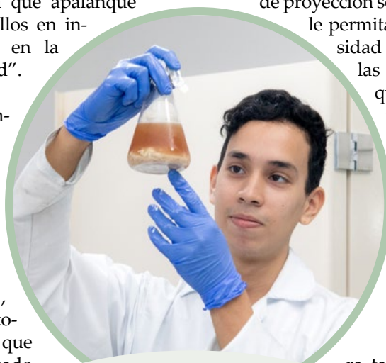
La Universidad Surcolombiana cuenta actualmente con cerca de 170 semilleros de investigación; aunque algunos inactivos, la investigación hace parte esencial del concepto mismo de universidad y estos cumplen un papel central en la vida universitaria.