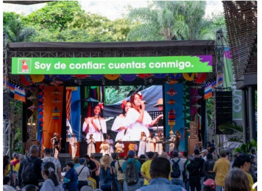
La alegría colectiva como fuerza transformadora, es uno de los objetivos de estos eventos a realizarse en Medellín y Duitama.

El Bazar de la Confianza es un evento que desarrolla la cooperativa Confiar con el propósito de crear espacios que fortalezcan la economía solidaria, para esta edición 2026 no será una celebración cualquiera, en esta oportunidad el encuentro celebrará 25 años de realización en la ciudad de Medellín.